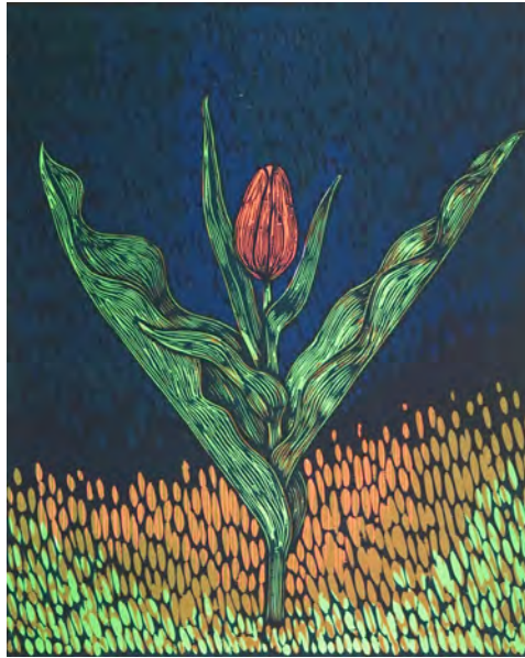
4. Peter Ern TULPAN Träsnitt 42 x 35 cm

Min fru odlar mycket blommor och ibland tecknar jag av dem. Jag har gjort flera träsnitt med blommor som jag har ritat av i trädgården. Den här tulpanen kom väldigt tidigt. Den var liten och på väg upp med sina knöliga blad. Både skör och stöddig.