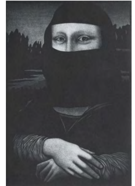
6. Jukka Vänttinen MONA Mezzotint 30 x 20 cm

Detta tryck, "Lugn", representerar ett sällsynt tillstånd: en känsla av fred, ordning och lugn, fri från oro eller störningar. Ett sådant tillstånd kan vara en svårfångad sensation i det moderna livet. På månen, för femtio år sedan, kunde mänskligheten för allra första gången vända sig om och se på hela jorden som externa observatörer och såg att den vara fridfull, vacker och lugn. Min förhoppning med detta tryck är att dess betraktare kan stanna upp och njuta av ett ögonblick av lugn innan de återupptar vardagen.