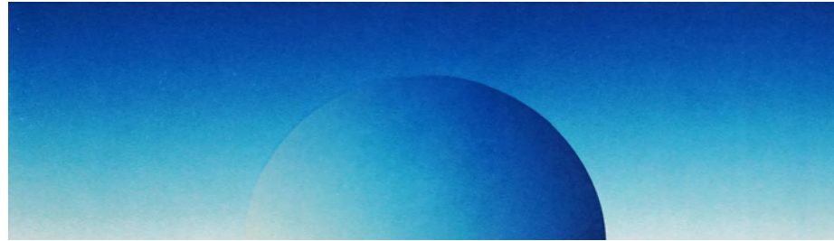
5. Jenny Palmer TRANQUILLITY, Collografi 17 x 42 cm

Min fru odlar mycket blommor och ibland tecknar jag av dem. Jag har gjort flera träsnitt med blommor som jag har ritat av i trädgården. Den här tulpanen kom väldigt tidigt. Den var liten och på väg upp med sina knöliga blad. Både skör och stöddig.