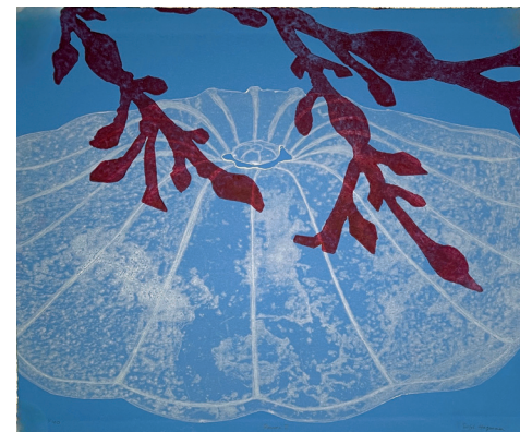
7. Sofi Hagman Rami II (grenar på italienska) screentryck och etsning 38 x 32 cm.

Mina bilder föreställer ofta djur som inte finns men påminner på något sätt om de redan existerande. När jag börjar teckna vet jag sällan vart det leder men efter ett tag hittar jag deras känsla och styr i känslans riktning. Ett sinnestillstånd som jag eller en annan betraktare kanske kan identifiera sig med eller ställa sig frågande inför. Många av djuren reflekterar saktmodigt över märkliga samhällsfrågor