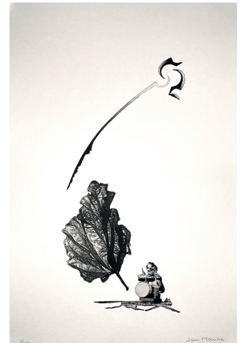
8. Jan Manker Trummis torrnål och fotopolymer 33 x 48 cm.

Varför bilden ”Brevlådan” var det någon som frågade. Svaret blev efter lite funderrande, ”Varför inte, det öppnar ju upp för många fantasier”.