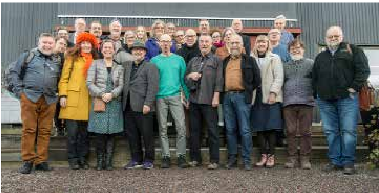
Mötesdeltagare vid nätverksträffen i Norrköping 25 januari

En ny ansökan om produktionsstöd skickades in i augusti till Kulturrådet, men