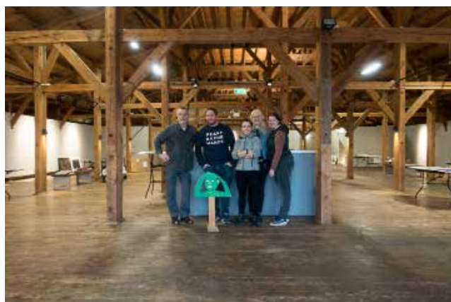
Tre bilder ovan: Från Grafiktriennalen i Norrköping