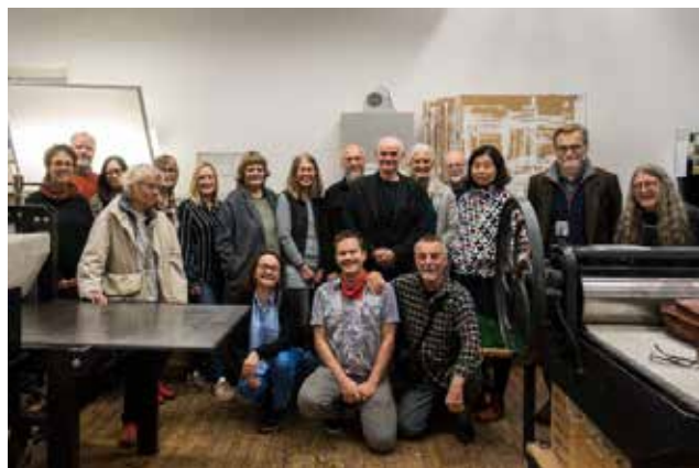
Höstmötet på Ålgården i Borås