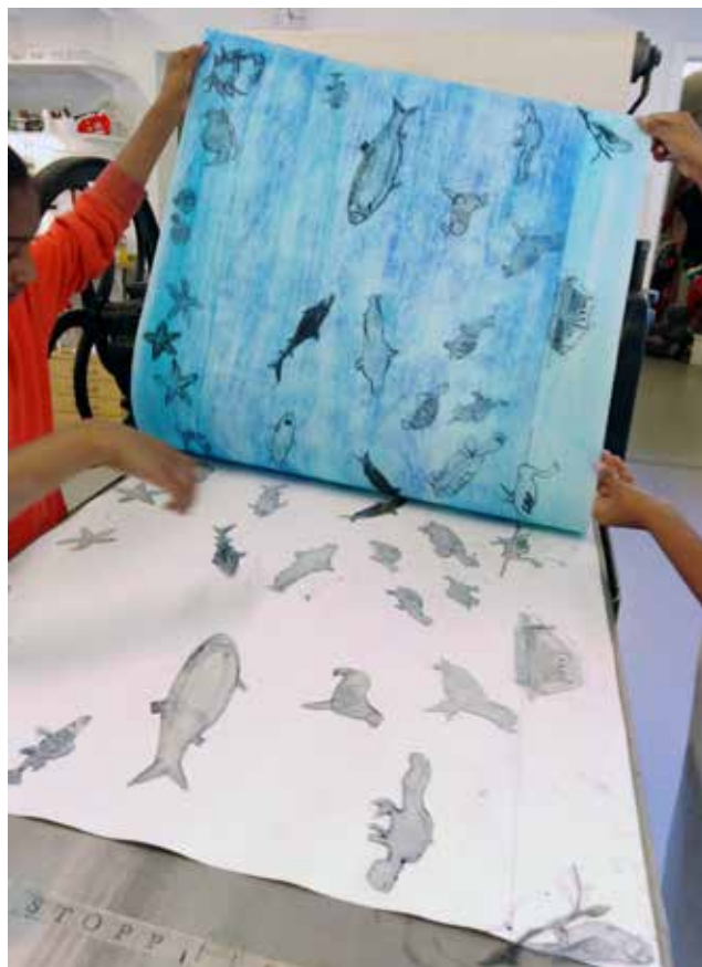
Tema vatten på Art Camp 2019.

Vi sökte utrustningsbidrag från Kulturrådet inför 2020 men ansökan avlogs. Ett verkstadsmöte och städdag för alla med-