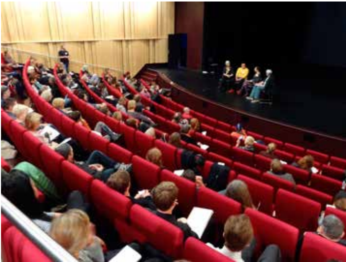
Två bilder från "Printmaking in the Expanded Field"

För 2-3 år sedan hördes en curator tala vid ett seminarium för grafik. Var gärna grafiker, sa han. Det är ok. Gör grafik. Men prata inte om det! Prata inte om tekniker och papperskvaliteter, syror och skärverktyg. Ingen är intresserad! Inte Konstvärlden. Inte publiken. Inte konstmarknaden heller.