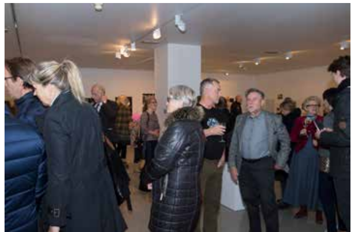
Två bilder från Akureyri

Under hösten 2014 fick GS styrelse en förfrågan från Isländska grafiker angående intresset för att delta i en gemensam nordisk grafikutställning under hösten 2015..