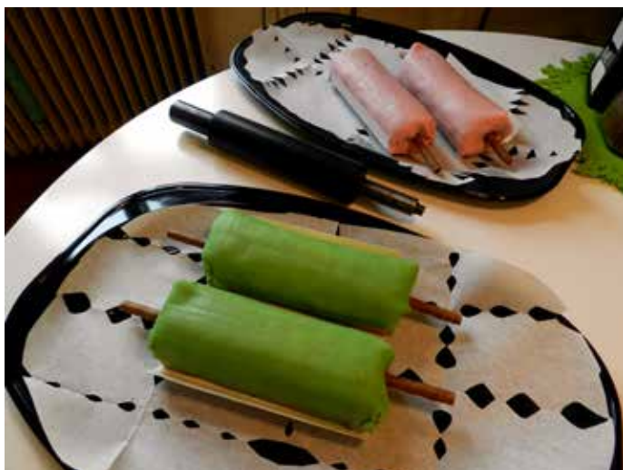
tårtkalas på World Art Day

På eftermiddagen var det dags att åka till Konstmuseet och inviga utställningen. Muséets chef, borgmästaren och GS ordförande höll varsitt kort tal. Därmed var det officiellt invigt.