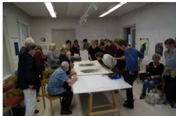
"Open-table"-visning av grafiska arbeten under Ende-gra-veckan i augusti.