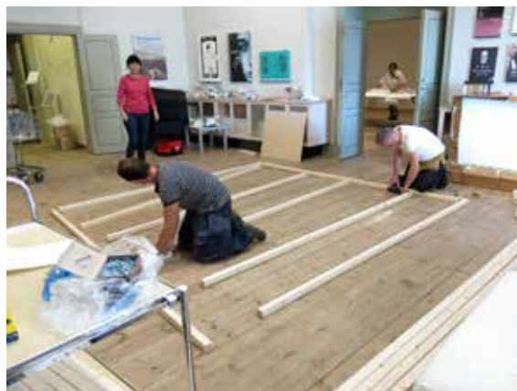
från bygge och hängning av Triennalen

Dessutom hängde affischerna från Slussenprojektet synliga i galleriet under en av perioderna i juli.