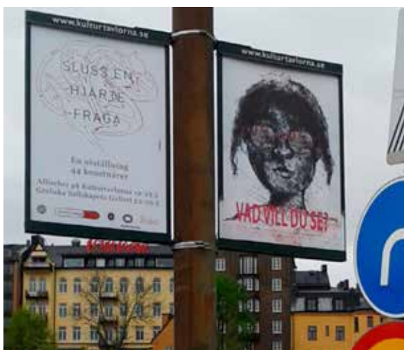
Slussen-projektets affischer ute på Stockholms kulturtafvlor

Ett flertal av föreningens medlemmar deltog i det årliga Endegra-symposiet som i år arrangerades av