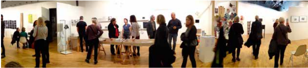
Från den gemensamma monter på Supermarket där Grafik i Väst och Grafiska Sällskapet samarbetade