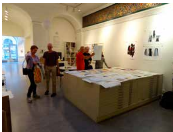
Uttagning av portföljblad på galleriet